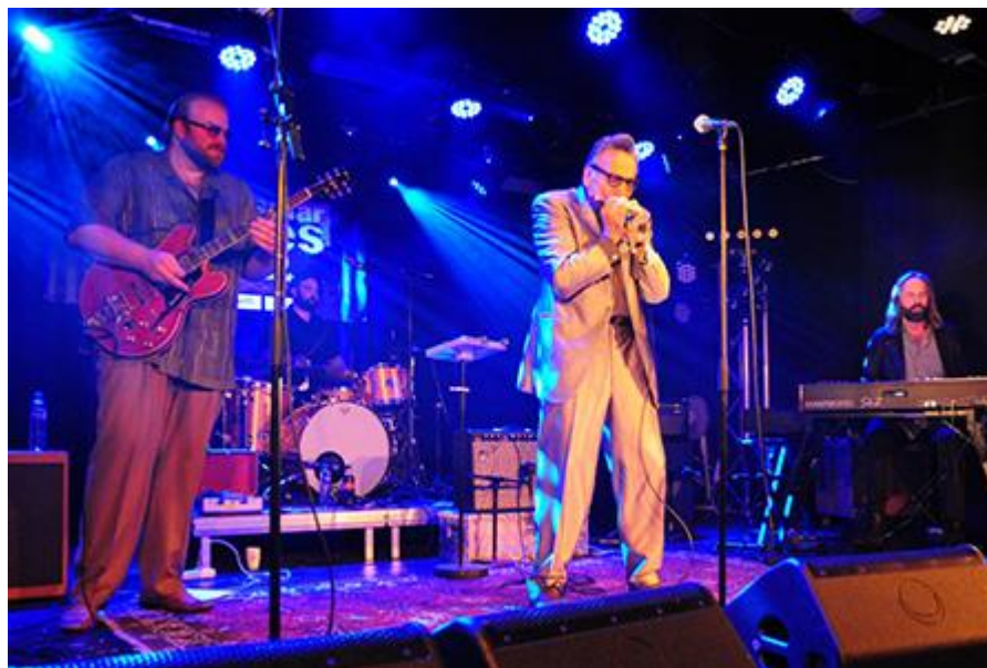
Rick Estrin & The Nightcats