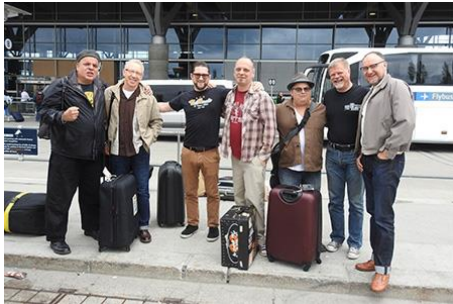
(På vei hjem.)