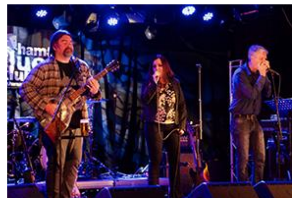
Slidehand & The Symphony