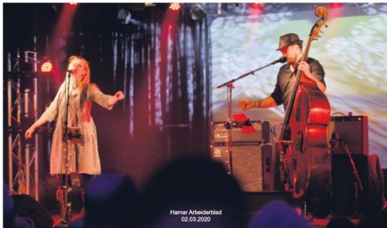
Hamar Arbeiderblad 02.03.2020